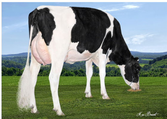
VALRUEST HAMPTON SOFIA