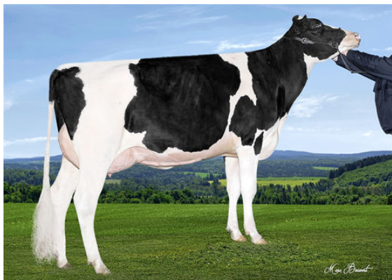
VALRUEST HAMPTON SOFIA